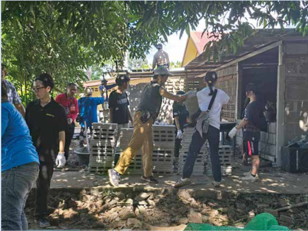
タイ国ピッサヌローク県・バンクラーン村でのワークキャンプ(トイレ改修)