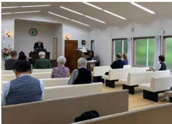
秋津教会での礼拝風景

また、6月から9月の間に、秋津教会を会場に外部の教会・関係団体の講演会が3回も開催されました。それぞ